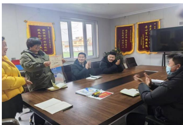
图 20党支部换届竞选工作会

在制度保障方面，学校建立健全党建工作制度体系，明确党组织的工作职责和运行机制，为党组织开展工作提供有力保障。通过制定和完善各项规章制度，规范党组织生活，加强党员考核评价，推动党建工作科学化、规范化发展。此外，学校还积极探索党建工作与业务工作深度融合的有效途径，将党建工作贯穿于学校教育教学、科研创新、社会服务等各个环节，以高质量党建引领学校高质量发展。学校严格执行三会一课、主题党日、组织生活会、民主评议党员等“见图20”，做到全程纪实、规范存档。