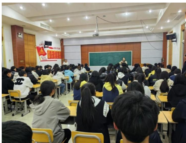
图 11 实习指导老师指导实习分享会

典型案例11： 微元合成药企技术代表受邀来校举办实习指导暨行业前沿分享大会。公司技术代表介绍了合成生物技术在药物开发等领域的应用，并讲解了行业对从业人员在操作规范、数据真实及质量体系方面的严格要求，使学生从产业前沿视角深化了对工匠精神当代价值的理解。