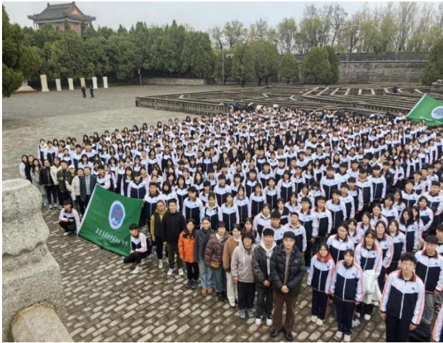
此数据来源于学校研学活动统计 图 13全校师生参观山海关长城古迹