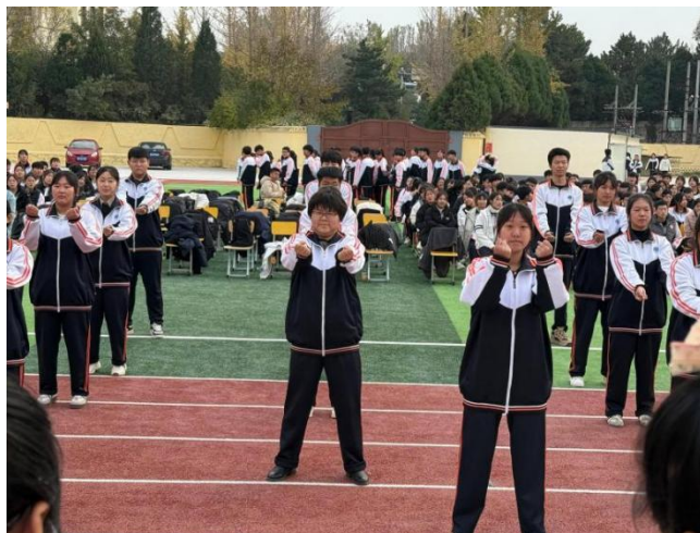
图 4教学处主任跟同学一起参加大众拉筋操比赛的照片

在心理健康教育方面，配备专业心理咨询师，为学生提供心理咨询和辅导服务，帮助学生解决学习和生活中的心理困扰，促进学生身心健康发展。专业心理咨询师定期开展心理健康讲座和个体辅导，帮助学生应对学习和生活中的压力，学生们的心态更加积极向上，能够以更加饱满的热情投入到学习和生活中。分层教学和个性化辅导则让不同层次的学生都能在自己的最近发展区内得到提升，学习困难的学生逐渐跟上教学进度，学有余力的学生则能够进一步拓展知识面和技能水平。