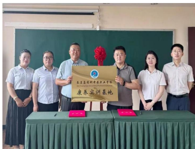
图 10与秦皇岛市北兴企业管理咨询有限公司签约仪式

此次双方携手合作拓展康养项目，将充分发挥各自的优势。通过整合企业的市场资源和学校的教育资源，共同打造一个集教学、实践、科研、服务于一体的康养产业平台。一方面，为学校的学生提供更多的实践机会和就业渠道，提升学生的专业技能和综合素质；另一方面，也将助力企业在康养市场的拓展，推动康养行业的规范化、专业化发展，为广大民众提供更加优质、高效的康养服务。我们相信，这次合作必将实现互利共赢，为双方的发展注入新的活力，也将为康养行业的发展做出积极的贡献。随着人们健康意识的不断提高，康养行业迎来了前所未有的发展机遇。秦皇岛市北兴企业管理咨询有限公司在企业管理、市场运营等方面拥有丰富的经验和专业的团队，具备强大的市场开拓能力和资源整合能力。而秦皇岛药科中等职业学校作为培养专业医药人才的摇篮，在医药学教育领域深耕多年，拥有雄厚的师资力量、完善的教学设施以及丰富的实践教学经验，为社会输送了大量优秀的医药专业人才。