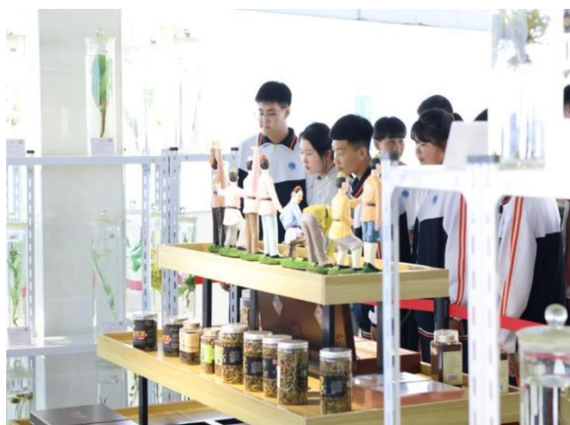
图 2 学生在实验室上课的照片