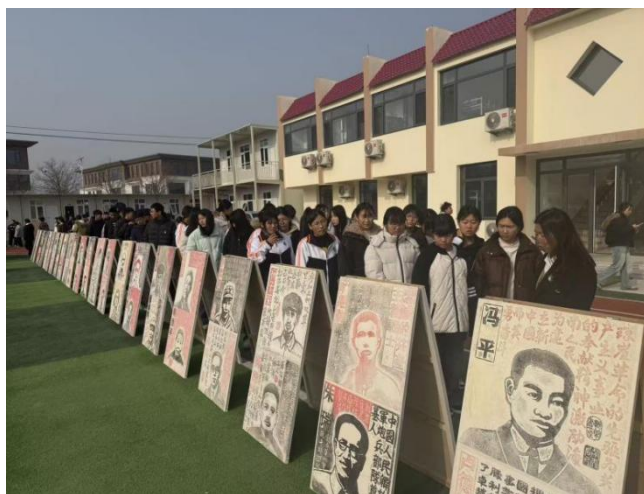
图 7“红色传承、爱国教育”红色文化进校园