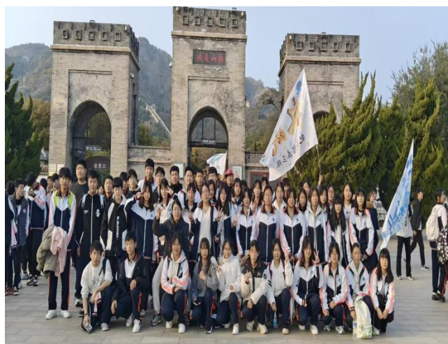
图 22爬角山长城、感受长城精神

深化实践育人，提升综合素养本次研学打破课堂教学的局限，将历史文化知识与实地体验相结合。活动后，师生纷纷表示要以长城精神为指引，立足本职岗位与学习任务。教师将把长城文化融入德育与专业教学中，助力学生全面发展；学生则立志勤奋学习，练就过硬本领，将来为传承中华优秀传统文化、建设祖国贡献力量。