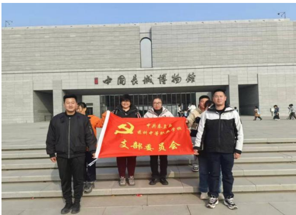
表 8党组织建设及活动统计