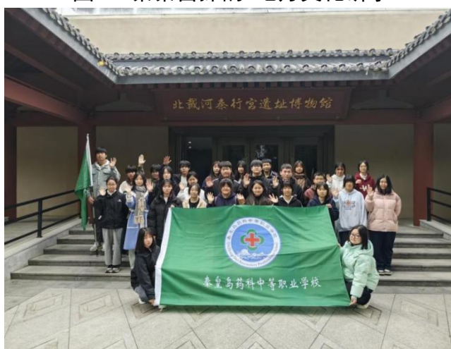
图 18秦秦宫探韵·地方文化研学

呈现课程成效：通过课堂融入与专题项目学习，学生们对秦皇岛独特的历史文化与医药养生传统表现出日益浓厚的兴趣，认知从模糊走向清晰，从表层了解转向深度探究。在教学反馈中，学生普遍认为融合了地方文化元素的课程内容“更有趣”、“更接地气”、“更能激发学习主动性”，相关课程模块的学生满意度保持较高水平。这证明，地方文化的融入有效增强了专业教学的吸引力和感染力。